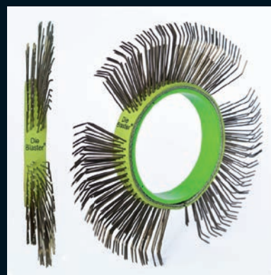
Die Blaster® štětinový pásek, ocel, 11 mm, jednořadý, levý, světle zelený

Balení 5 pásků Číslo zboží DB-106-05 Balení 10 pásků Číslo zboží DB-106-10