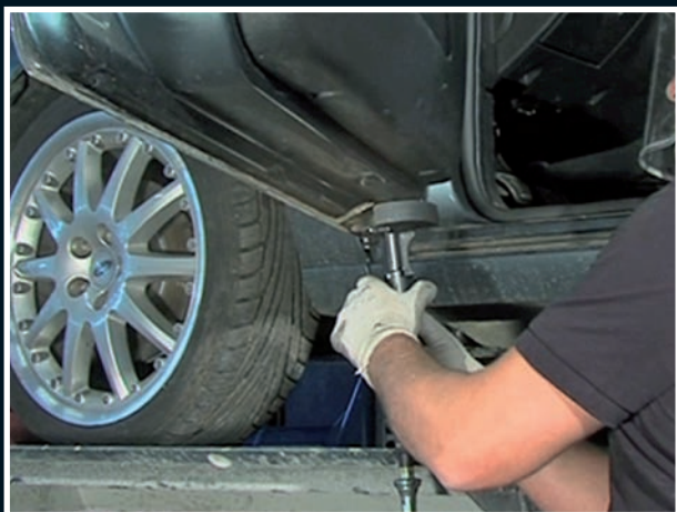
dveřních lemů /dveřních těsnění