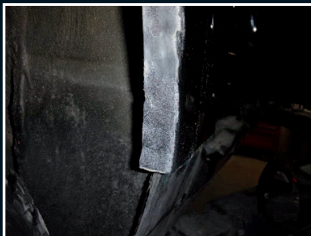
lemů v podběžích