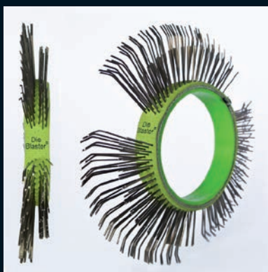
Die Blaster® štětinový pásek, ocel, 11 mm, jednořadý, pravý, světle zelený

Balení 5 pásků Číslo zboží DB-105-05 Balení 10 pásků Číslo zboží DB-105-10