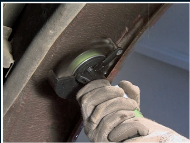
vnitřních stranách podběhů