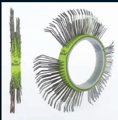
Die Blaster® štětinový pásek, nerez, 11 mm, jednořadý, pravý, světle zelený

Balení 5 pásků Číslo zboží DB-110-05 Balení 10 pásků Číslo zboží DB-110-10