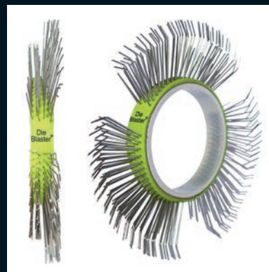
Die Blaster® štětinový pásek, nerez, 11 mm, jednořadý, levý, světle zelený

Balení 5 pásků Číslo zboží DB-108-05 Balení 10 pásků Číslo zboží DB-108-10