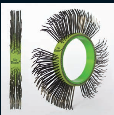
Die Blaster® štětinový pásek, ocel, 11 mm, světle zelený

Balení 5 pásků Číslo zboží DB-105-05 Balení 10 pásků Číslo zboží DB-105-10